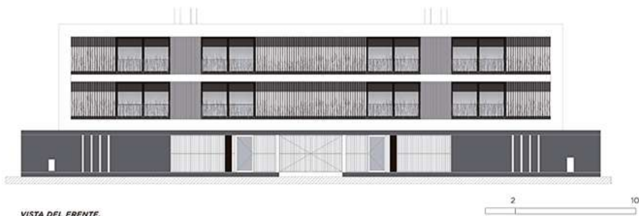
VISTA DEL FRENTE.